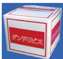
専用ビット 4本付 徳用箱